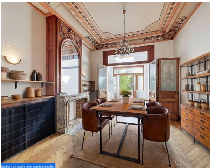
Section virtuelle non contractuelle